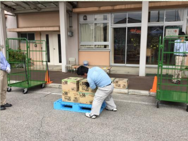
校内流通検定の様子 (流通・サービス)

40周年を記念して生徒公募によるゆるキャラグランプリを行いました。グランプリ作品の「足立ちゃん」です。