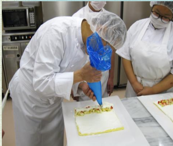
パン・ケーキ等の製造の実習 (家政)