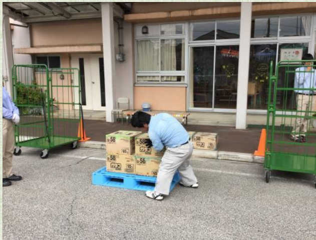
校内流通検定の様子 (流通・サービス)

40周年を記念して生徒公募によるゆるキャラグランプリを行いました。グランプリ作品の「足立ちゃん」です。