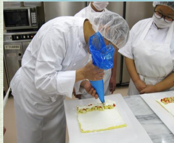
パン・ケーキ等の製造の実習 (家政)